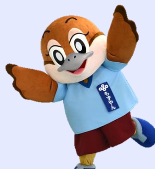
大阪府広報担当副知事 もずやん